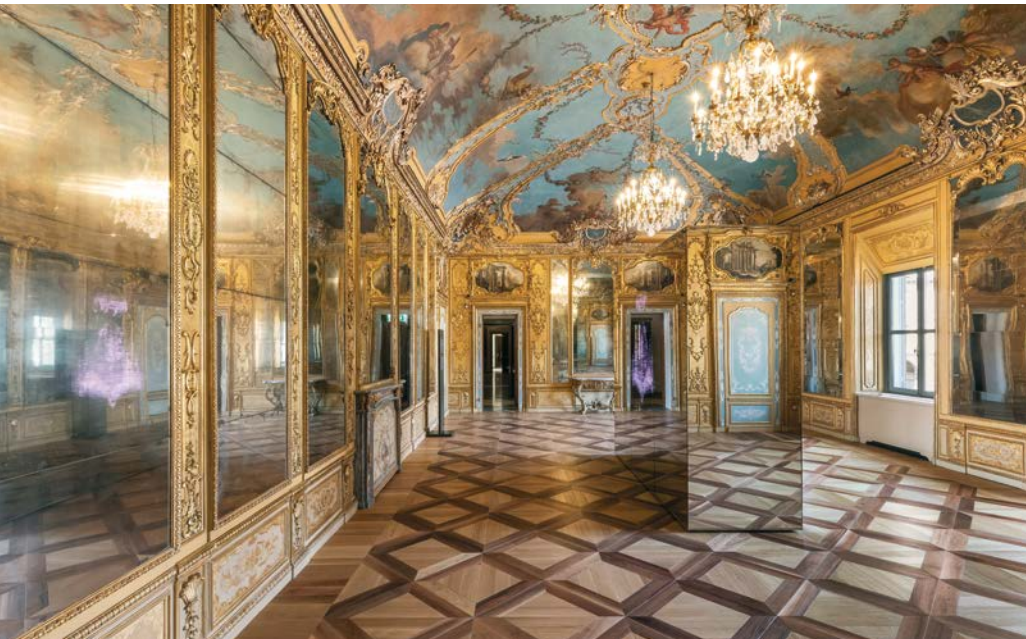
Gallerie d'Italia - Torino Sala Turinetti Piazza San Carlo 156, Torino Interno della nuova sede museale Progetto AMDL CIRCLE e Michele De Lucchi