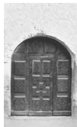
19. Aosta Portale del Palazzo di Via Saint-Bernard de Menthon