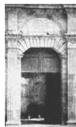
17. Cagliari Veduta della Porta Cristina