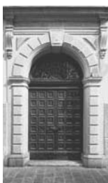
15. Bolzano Palazzo di Viale della Roggia