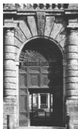
2. Roma Particolare della facciata di Villa Giulia