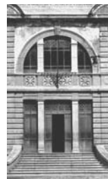
23. Potenza Particolare della Scuola Industriale