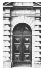
11. Bologna Particolare della facciata del Palazzo Montpensier