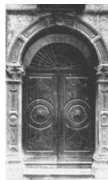
22. Trento Portale del Palazzo del Monte o Rehr