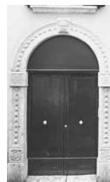
5. Campobasso Palazzo di Via Sant'Antonio Abate