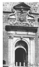
18. L'Aquila Portale del Castello