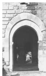
16. Bari Castello Svevo, Porta meridionale