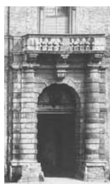
8. Forlì Particolare di Palazzo Paulucci