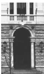
9. Rovigo Portale del Palazzo delle Poste e Telegrafi