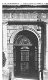
10. Napoli Particolare del Palazzo Carafa d'Andria