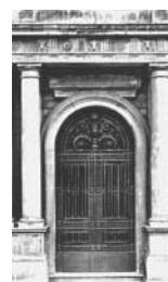
12. Milano Particolare della facciata di Palazzo Marino