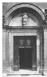
13. Perugia Porta del Palazzo del Capitano del Popolo