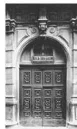
6. Torino Portale del Palazzo Saluzzo di Paesana