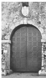
20. Trieste Porta fortificata d'ingresso del Castello di Duino