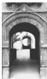
14. Palermo Portale del Palazzo arcivescovile