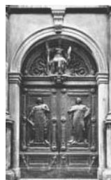
1. Padova Portale in bronzo del Palazzo dell'Università

Intesa Sanpaolo è la banca con maggior diffusione sul territorio nazionale. Leadership che deriva, oltre che dalle sue dimensioni, dalla capacità di interpretare e rispondere alle esigenze dei territori nei quali è presente. Risponde a questa volontà la scelta di mantenere e valorizzare tutte le banche del gruppo, che consentono a Intesa Sanpaolo di presentarsi sul mercato come cittadina a pieno titolo di tutti i luoghi in cui opera. E' per questo che il corredo iconografico del bilancio che descrive i primi risultati della fusione tra Banca Intesa e Sanpaolo IMI ha tratto ispirazione dal ricco patrimonio culturale delle nostre città. A rappresentarle sono stati scelti gli ingressi di dimore storiche di particolare rilevanza di ciascun capoluogo di regione e di quelle città presenti nelle denominazioni delle banche. E' un omaggio alla tradizione e alla storia italiana nelle sue infinite variazioni. Ma è anche il segno di una volontà comunicativa e di relazione che connota l'attività delle persone di Intesa Sanpaolo e delle banche del gruppo.