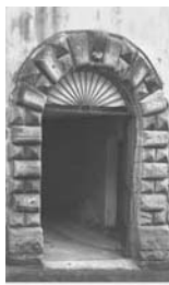
21. Catanzaro Particolare di Palazzo Castagna