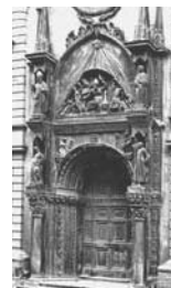
24. Ancona Portale gotico-veneziano dell'ex chiesa di S. Agostino