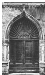
4. Venezia Porta presso il Ponte dei Calegheri