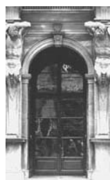
7. Genova Portone con telamoni del Palazzo Durazzo