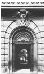
3. Firenze Portale del Casino Mediceo